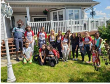
Programa de curta duração em High School Canadense