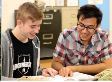
DURAÇÃO De 4 a 12 semanas (de novembro a fevereiro)