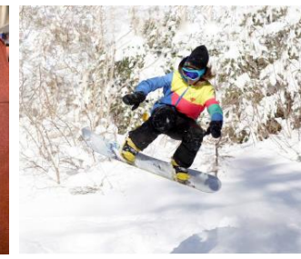
HOSPEDAGEM em casa de família referenciada